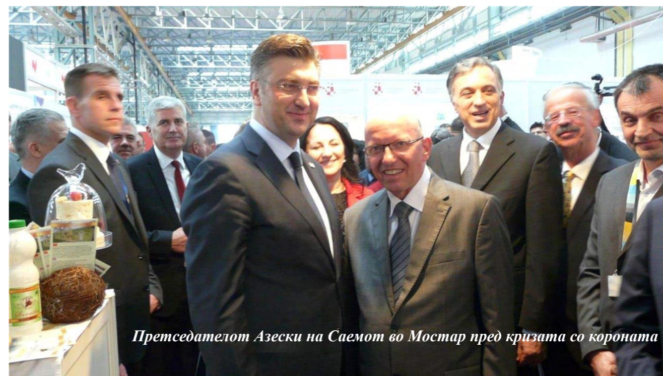
Претседателот Азески на Саемот во Мостар пред кризата со короната

Дваесет и третиот меѓународен бизнис-саем во Мостар, кој ќе се одржи во периодот од 5 до 9 април 2022 година, е една од најважните саемски манифестации во Босна и Херцеговина според бројот на изложувачи и на посетители. Мостарскиот саем е дел од мрежата на Здружението на изложувачи од Југоисточна Европа (ЕАСЕЕ).